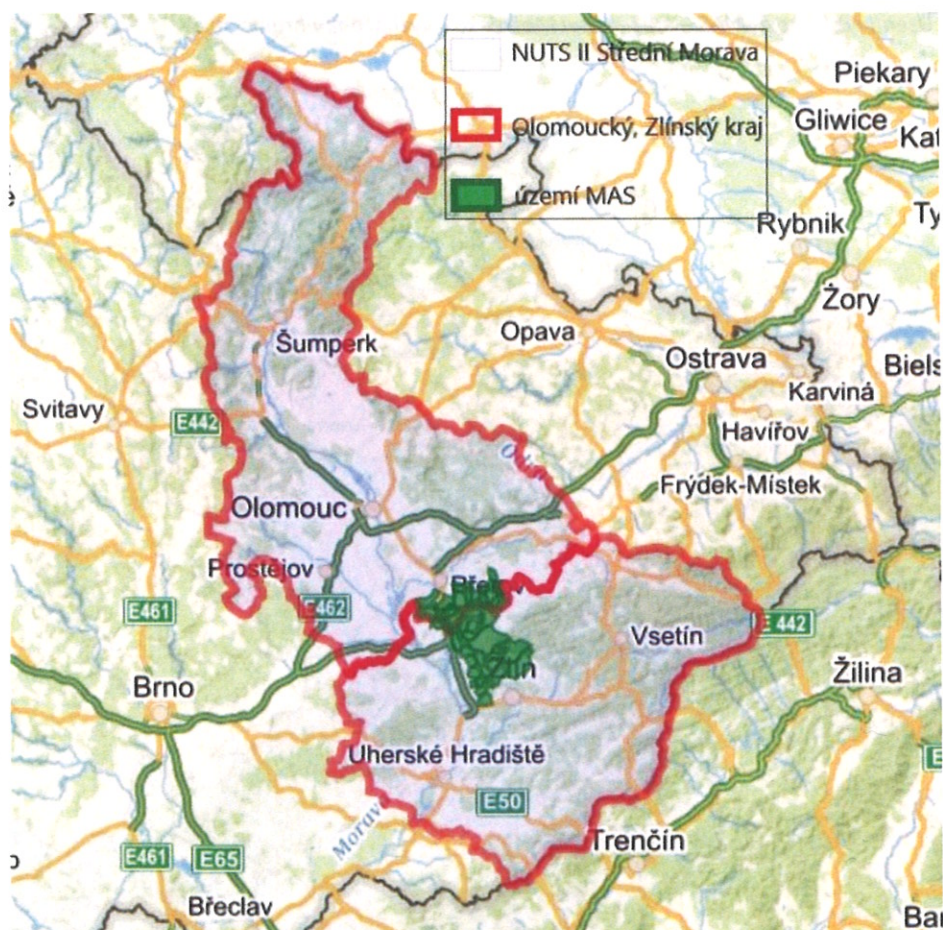
Obrázek 2 Území působnosti MAS – Partnerství Moštěnka v kontextu regionů NUTS2 a NUTS3