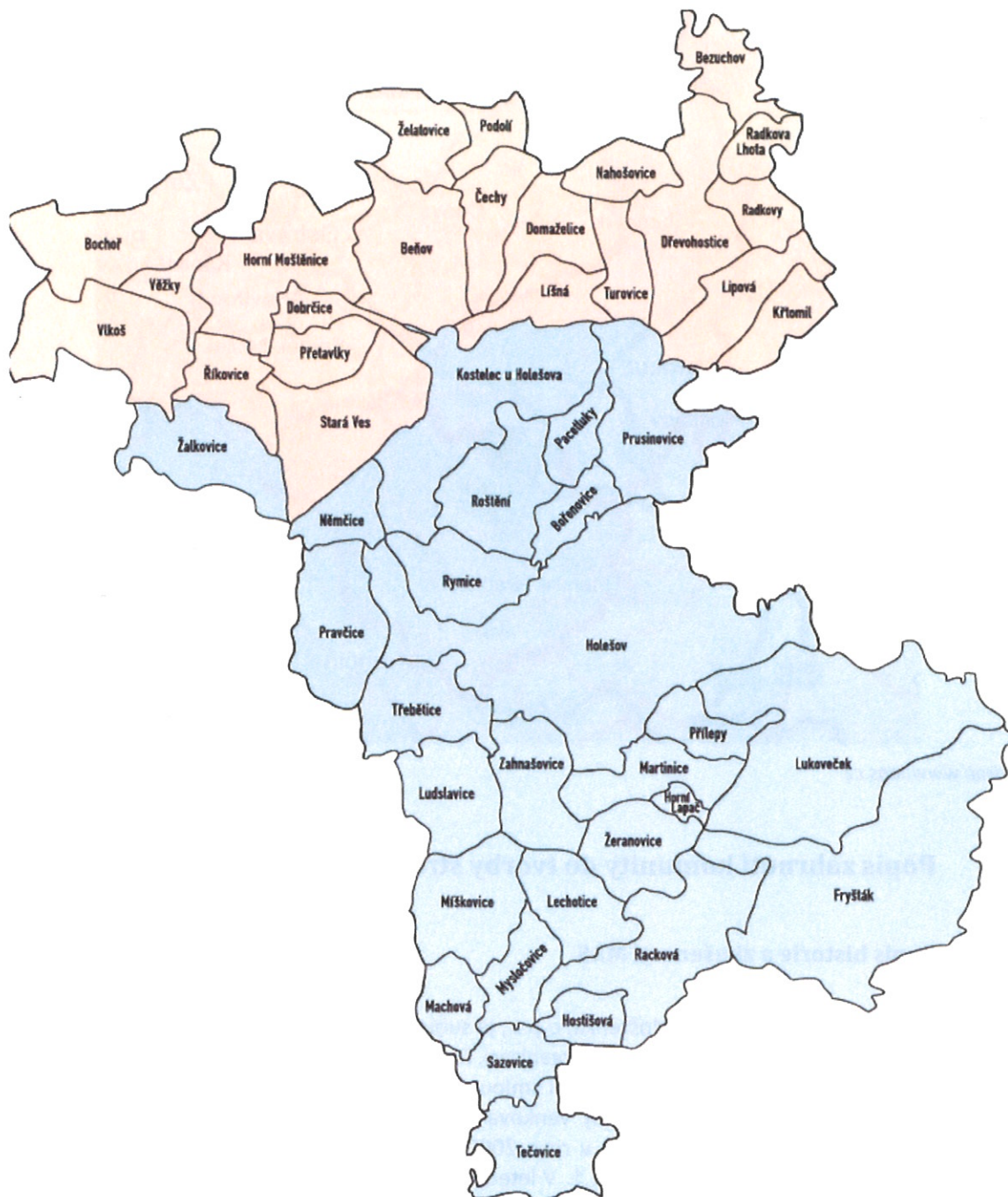
Obrázek 1 Území působnosti MAS – Partnerství Moštěnka s vyznačením hranic obcí