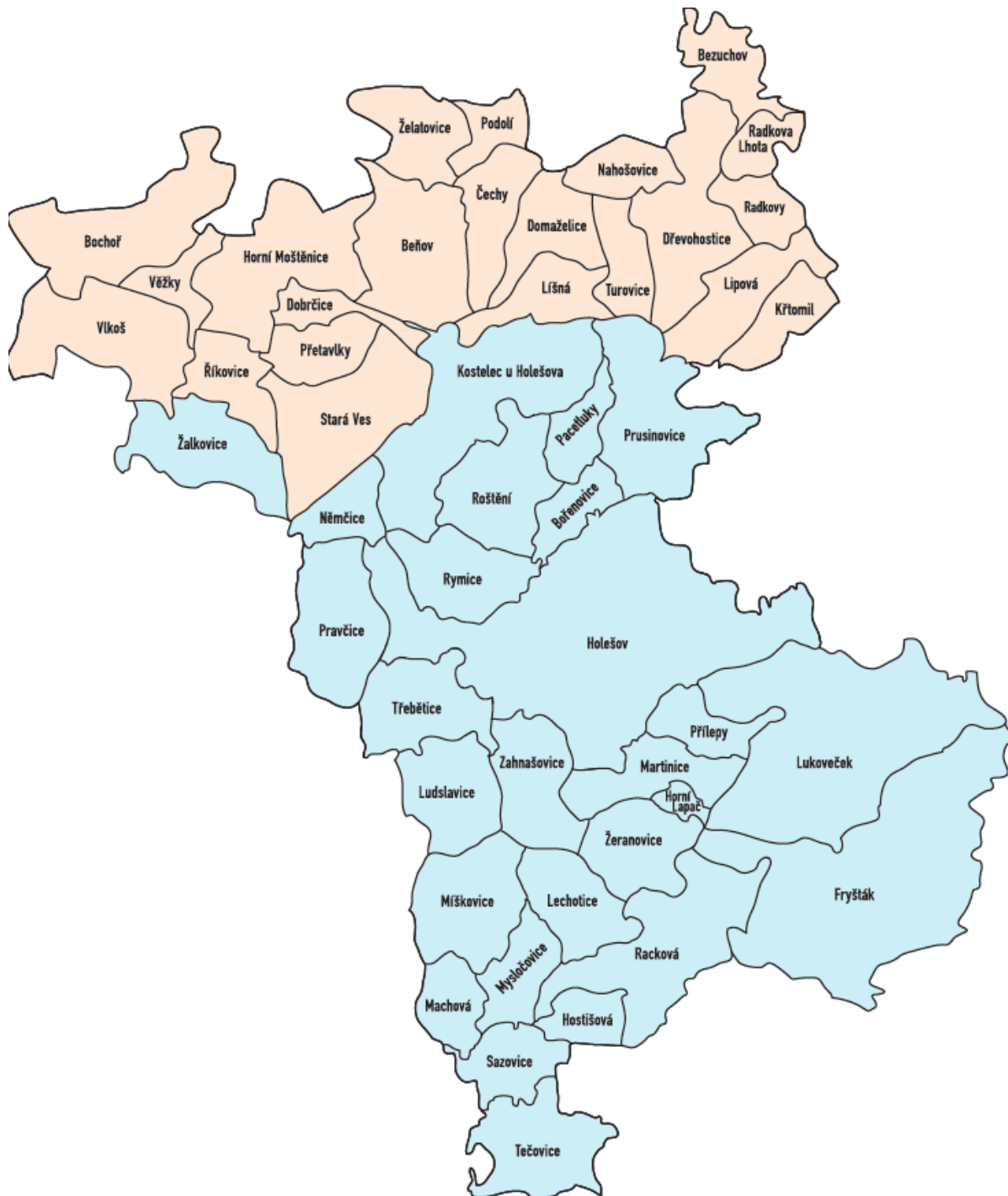
Obrázek 1 Území působnosti MAS – Partnerství Moštěnka s vyznačením hranic obcí