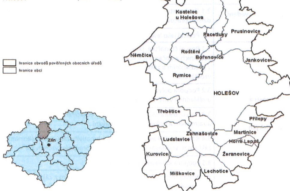
Administrativní mapa správního obvodu Holešov (stav k 1. 1. 2003)